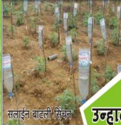
सलाईन वाटली सिंचन